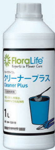
1L (原液) (100倍希釈)