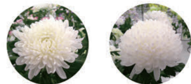
Clear200 + 水