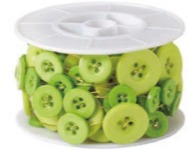
アップルグリーン