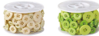
アイボリー アップルグリーン

大中小のボタンがアクセントになるので、単調になりがちなプリザーブドフラワーにも動きが出ます。さらに2色使いでボリューム感も出ています。