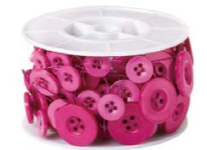
ストロングピンク